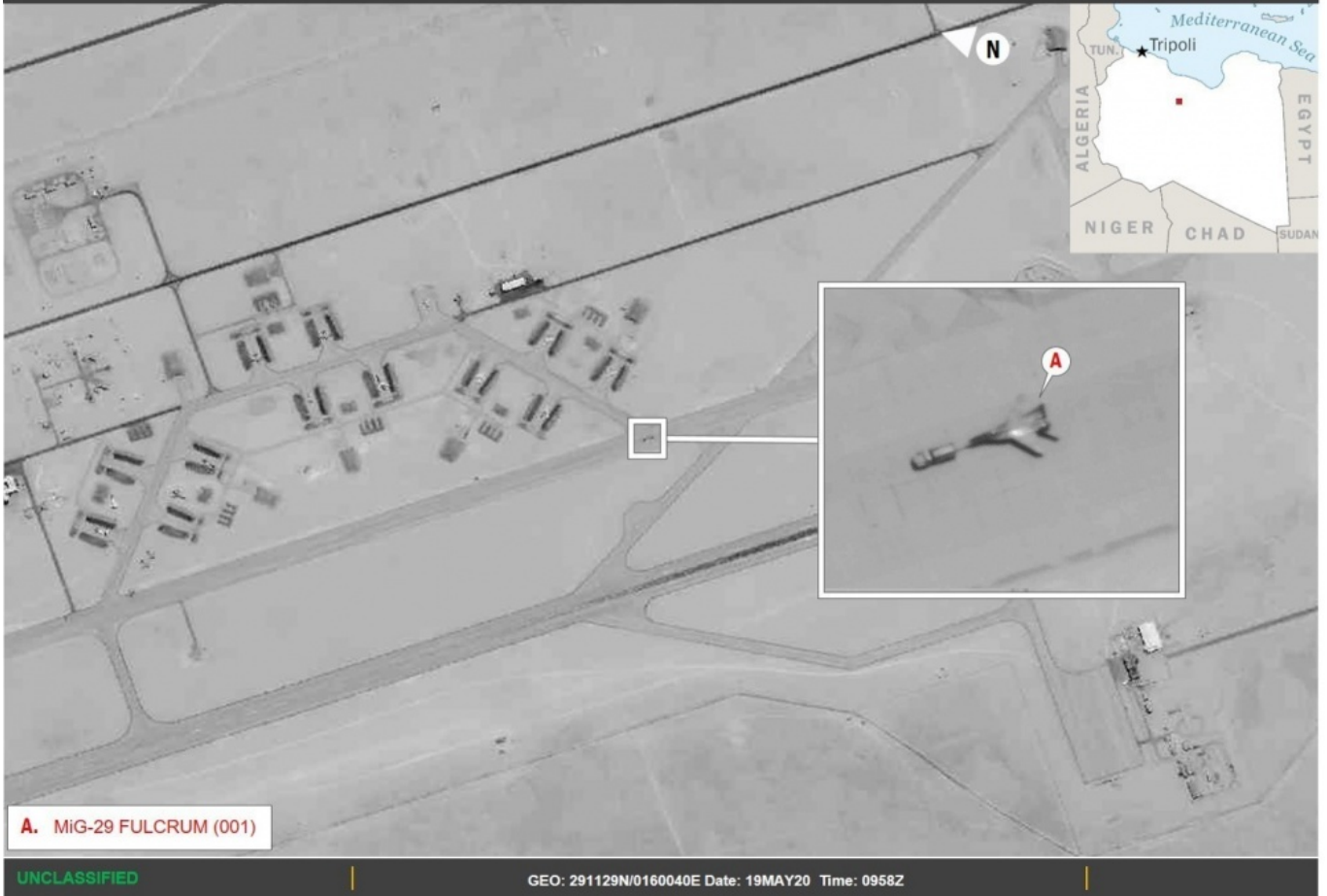
A. MiG-29 FULCRUM (001)