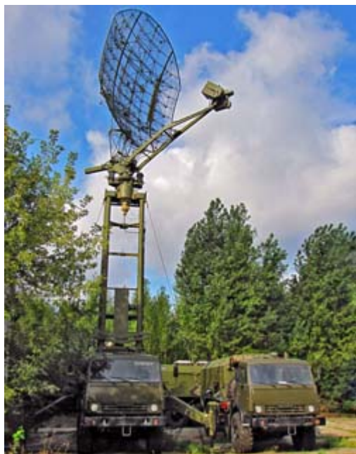
Stacja radiolokacyjna Kasta-2E1.

Pojawienie się na tych terenach radarów może budzić zdziwienie, ponieważ Ukraina nie wykorzystuje w tamtym regionie własnych statków powietrznych, zgodnie z regułami rozejmu z września 2014 r. („Mińsk I”) i lutego 2015 roku („Mińsk II”), a rebelianci nie mają własnego lotnictwa. Przypuszcza się jednak, że Rosjanie chcą w ten sposób zapewnić sobie systemowe wykrywanie obcych systemów bezałogowych pojawiających się nad tym terytorium: zarówno ukraińskich, jak i należących do OBWE.