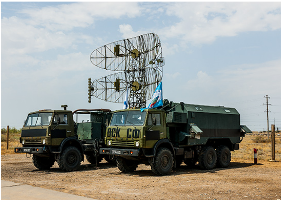
Radar P-19, który jest rozstawiany przez Rosjan na wschodniej Ukrainie.

Przykładem może być system radarowy, który został rozstawiony koło lotniska Mospyne (na wschód od Doniecka). Ze zdjęć satelitarnych wywnioskowano, że może to być dwuwspółrzędna stacja radiolokacyjna 1RL134/P-19 „Dunaj”, o charakterystycznym systemie antenowym, z dwiema, umieszczonymi jeden nad drugą, antenami parabolicznymi. Jest to zdecydowanie przestarzała stacja radiolokacyjna i trudno jest przypuszczać, by to właśnie ona miała być wykorzystywana do wrywania tak trudnych do śledzenia obiektów, jak drony.