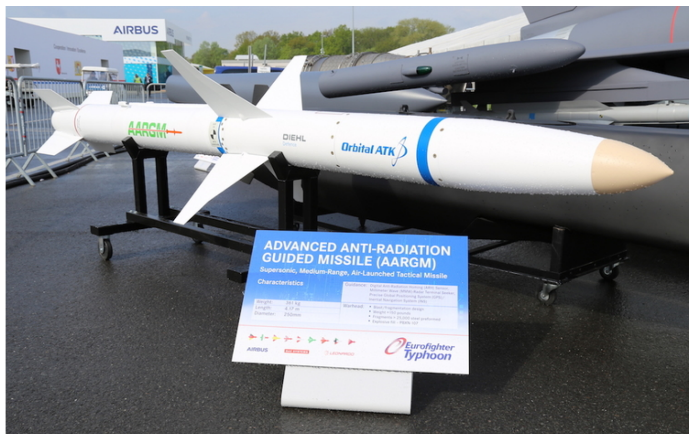
Pocisk AARGM był prezentowany wraz z samolotem Eurofighter podczas ILA 2018.

SRAAM i dalekiego zasięgu LRAAM. Specyficzne będą jednak dla niego dwa rodzaje dedykowanego uzbrojenia. Pierwszy to lekkie pociski kierowane SPEAR (ang. Select Precision Effects At Range) w wersji przeznaczonej do walki elektronicznej SPERA-EW. Zamiast głowicy pocisk wyposażony jest opracowany przez Leonardo miniaturowy moduł zakłócający, a niewielka masa amunicji powoduje, że maszyna może przenosić znaczną ich ilość (po trzy na każdy pylone podskrzydłowym), zyskując możliwość oślepienia nawet zaawansowanej i bardzo silnej obrony powietrznej. System ten powstał na zamówienie Wielkiej Brytanii w wyniku kooperacji koncernów MBDA i Leonardo. Wraz ze SPEAR-EW Eurofighter ECR SEAD może przenosić również klasyczną amunicji SPEAR3.