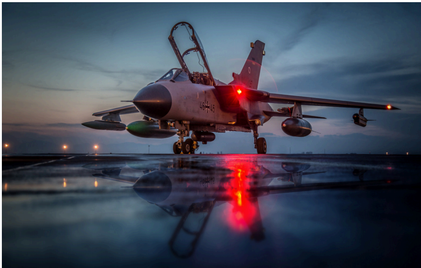
Tornado to wiekowe maszyny, które pilnie potrzebują następcy. Szczególnie, będąc jedynym niemieckim nosicielem broni jądrowej.

terminu uzyskania tej możliwości, gdyż jest to kwestia ustaleń pomiędzy rządem niemieckim i administracją USA, dotyczących integracji bomb jądrowych B-61 rozmieszczonych w Europie w programie współdzielenia broni jądrowej w ramach Sojuszu. Jest to bowiem dziś jedyna istotna strategicznie zdolność samolotów Tornado, której obecnie nie posiadają samoloty Eurofighter.