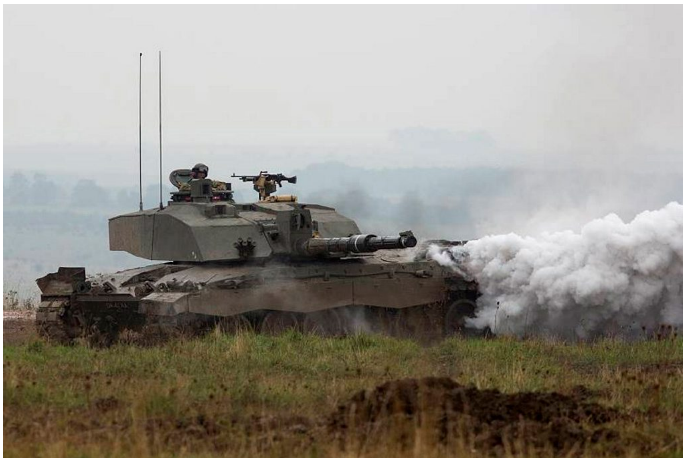
Czołg Challenger II

Z kolei Siły Obronne Estonii oraz Liga Obronna (Kaitseliit) wskazują na ten przerzut jako na okazję do przeciwiczenia wsparcia, jakiego udziela państwo goszczące siły NATO.