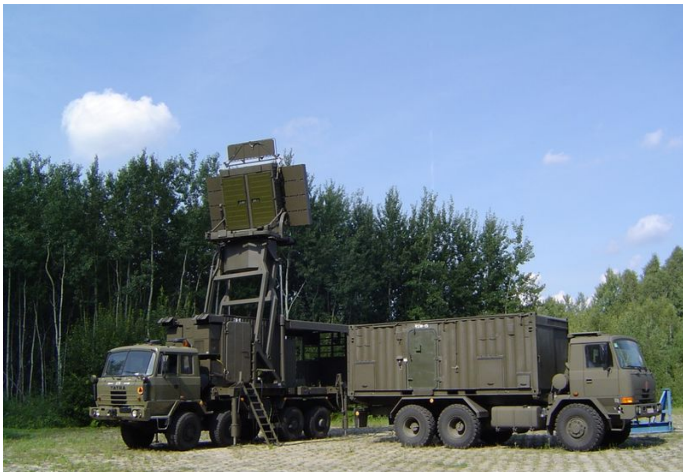
Stacja TRS-15.

Radary Odra-S są już używane w jednostkach radiotechnicznych Sił Zbrojnych RP i stopniowo przechodzą modernizację. Dzięki podpisanej umowie wojsko otrzyma kolejną partię stacji tego typu. Radary Odra są mobilne i mogą wypełniać luki w pokryciu radiolokacyjnym chronionego terytorium.