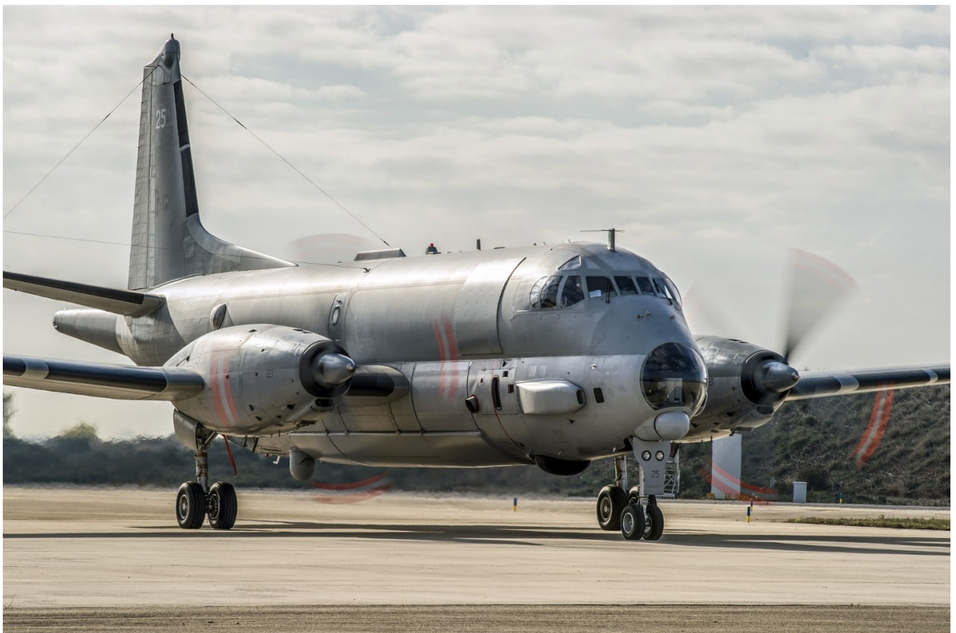
Atlantique 2 (ATL2).

Najważniejszą modyfikacją jest instalacja nowego radaru - Thales Searchmaster. Jest on zbudowany w oparciu o antenę z aktywnym skanowaniem wiązki (AESA) i korzysta z rozwiązań, które zostały użyte w samolotach Rafale. Jednakże zastosowane zostało na nim nowe, opracowane przez Naval Group, oprogramowanie zainstalowane na zbudowanych przez (SIAÉ) zmodernizowanych konsolach operatorów. W połączeniu z nowym systemem obróbki materiału zgromadzonego z boi sonarowych oraz nową głowicą elektrooptyczną Wescam MX-20 (znaną m.in. z amerykańskich samolotów P-8A Poseidon) pozwoliło to na stworzenie jakościowo nowego systemu zobrazowania sytuacji taktycznej oraz system planowania misji. Modyfikacji poddano też system kierowania ogniem, co pozwoli na jego dalsze modyfikacje w przyszłości, by mógł być dostosowywany do nowych rodzajów broni.